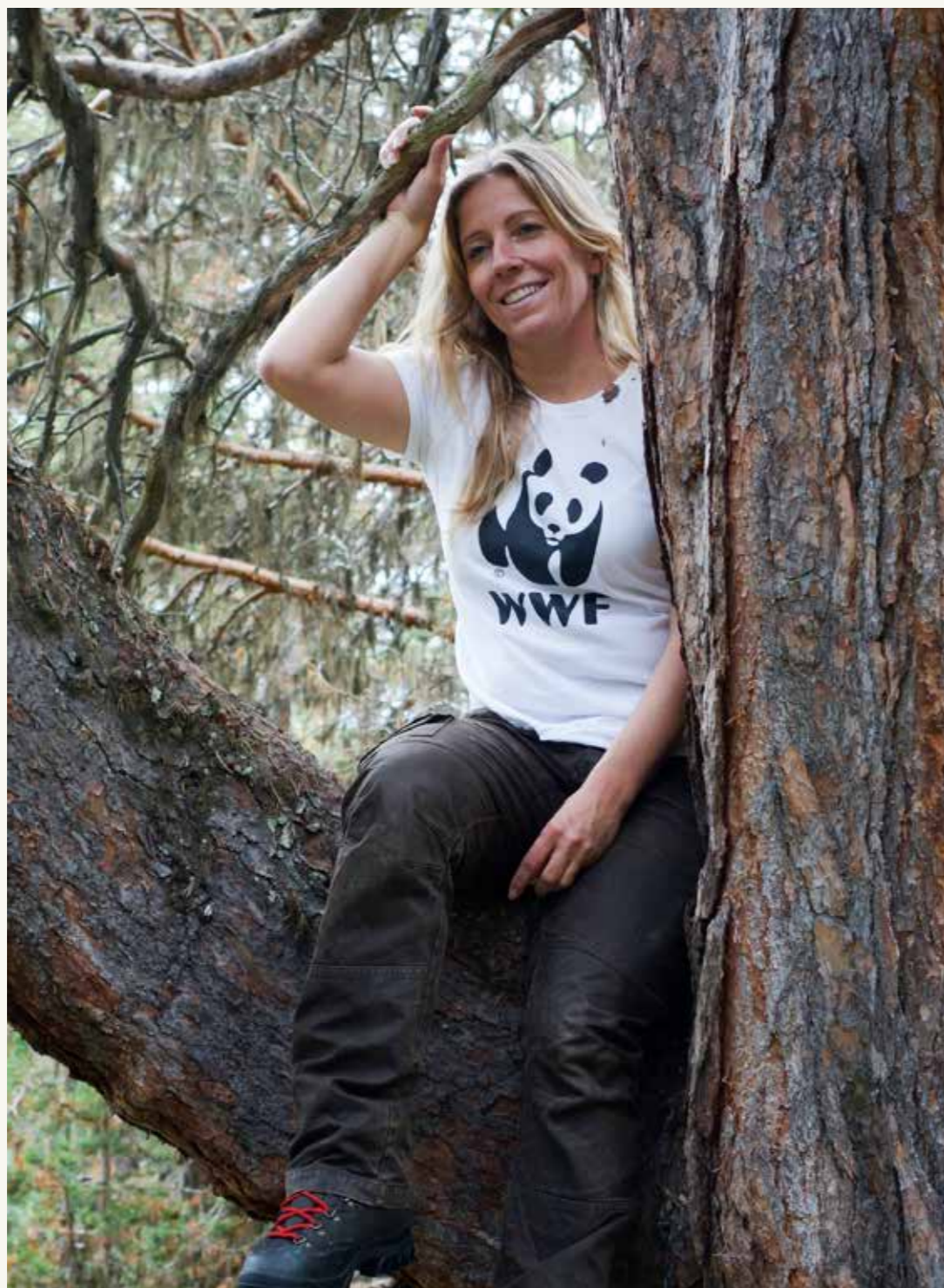
Våren 2016 vedtok Stortinget at ti prosent av den norske skogen skal vernes – mye takket være mangeårig innsats fra WWF Verdens naturfond. Her besøker jeg verneverdig skog i Lemonsjølia i Oppland.