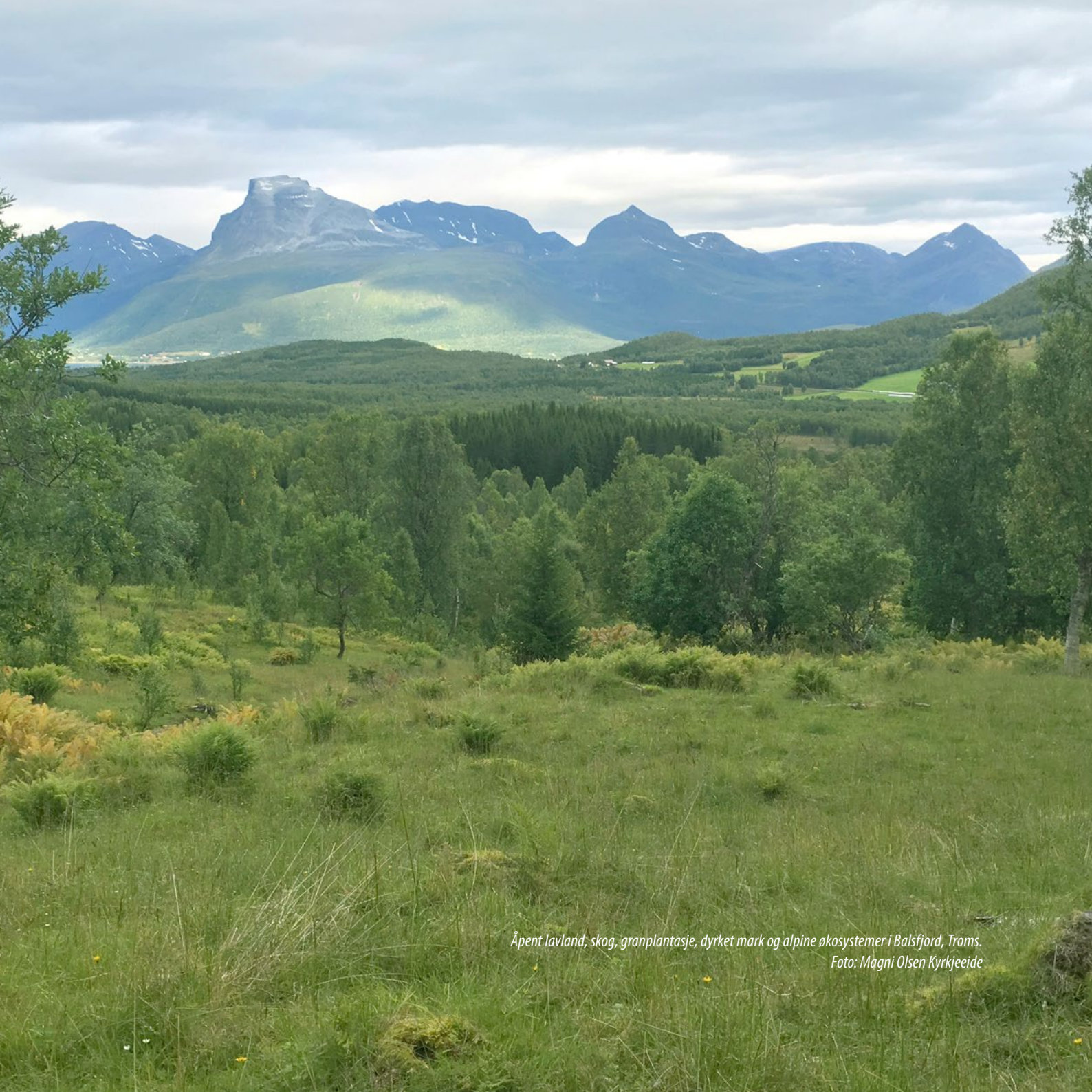
Åpent lavland, skog, granplantasje, dyrket mark og alpine økosystemer i Balsfjord, Troms.