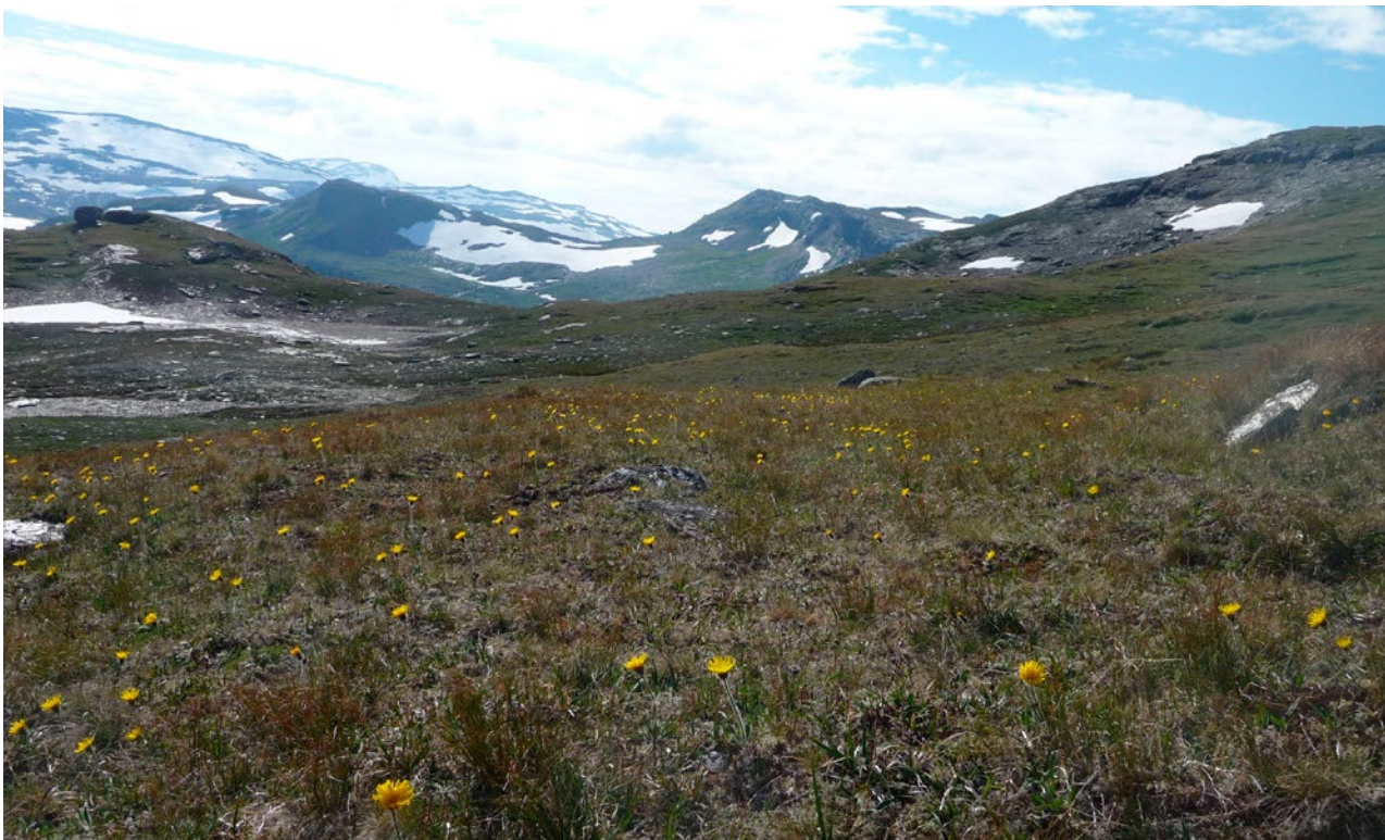
Grasrabbe i fjellet.

Siden 2000 har norske isbreer krympet betydelig, og vi har et kontinuerlig tap av karbon og karbonlagringskapasitet etter hvert som isen minker. Karbonlagrene i isbreer på fastlandet i Norge er relativt lave sammenlignet med lagrene i permafrosten på tundraen. Effekter nedstrøms for breene, som jordras og flom, vil imidlertid slippe ut karbon, og tap av isdekke vil føre til reduksjon av permafrost under isbreene. I tillegg vil vekst av vegetasjon på nylig isfrie områder føre til økt karbonopptak og lagring på lang sikt.