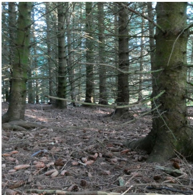
Plantefelt med tett beplantning av sitkagran hindrer etablering av vegetasjon i skogbunnen.