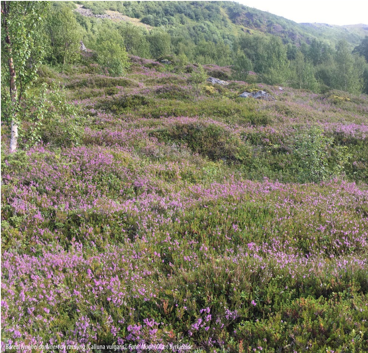
Boreal lynnhei dominert av røsslyng ( Calluna vulgaris ).