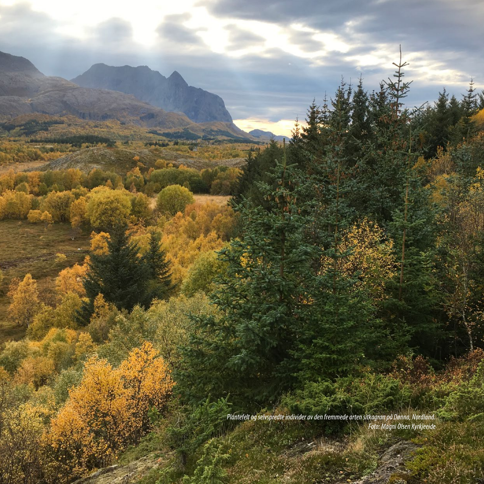
Plåntefelt og selvsprede individer av den fremmede arten sitkagran på Dønna, Nordland.