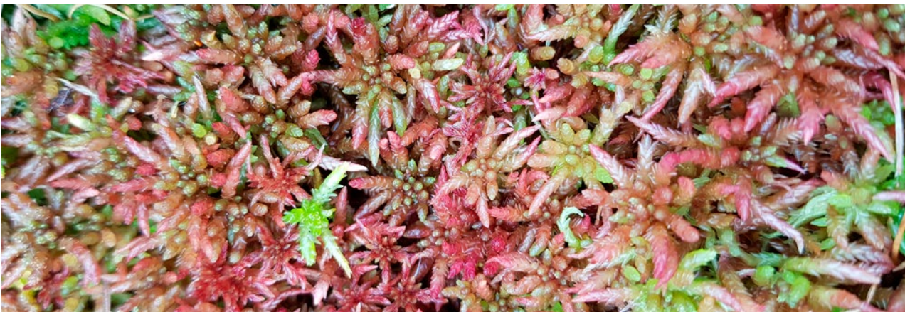
Abelstorvmose (Sphagnum divinum).

Klimaendringer vil føre til varmere somre og lengre tørkeperioder i noen områder. Det vil gi uttørring av myrområder. Nedbrytningen i myr kan da øke, og dermed slippes det ut karbon. Allikevel vil store mengder karbon forbli lagret i myr hvis de får stå uberørt. I områder med fortsatt høy og jevn tilgang på nedbør, kan produktiviteten og lagring av karbon øke. Det bør tas med i vurderingen når myr skal restaureres.